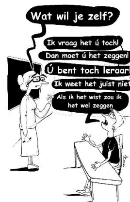
Bij tegenafhankelijke jongeren kan de vraag 'wat wil je zelf' veel boosheid oproepen

Dit vréét energie. U sleurt aan een dood paard. Ga vragen wat ze zélf willen.